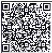
โครงการที่ 2