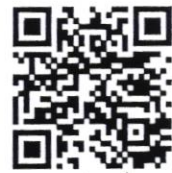
รายละเอียดเพิ่มเติม