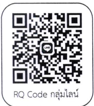
RQ Code กลุ่มไลน์