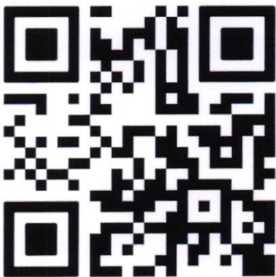
QR CODE สำหรับสมัคร

หมายเหตุ: โปรดนำบัตรนักศึกษาหรือหลักฐานแสดงสถานะนักศึกษามาแสดงเพื่อรายงานตัวก่อนแข่งขัน