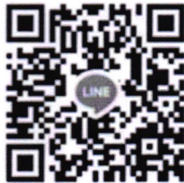
QR CODE กลุ่มไลน์ผู้เข้าแข่งขัน