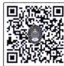
QR Code แบบสำรวจ